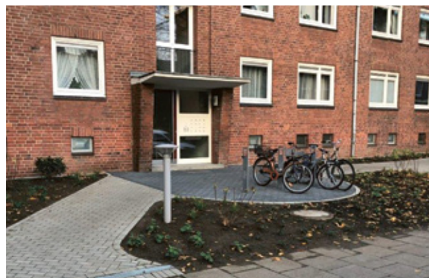
Neue Eingangsbereiche und Fahrradstellplätze