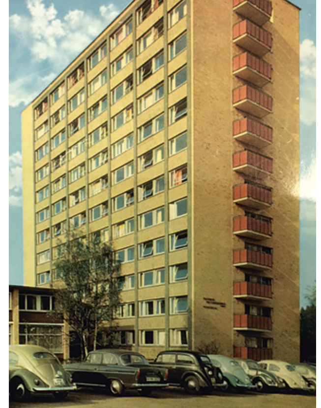
Der Alsenplatz 2 in den 60'er Jahren

Ich gehe weiter, nehme einen kleinen Umweg durch das sehenswerte Eppendorfer Moor, das größte innerstädtische Moor Mitteleuropas, zu unseren gerade neu bezogen Wohnungen in der Martinistraße/Frickestraße. Das ehemalige Krankenhaus Bethanien heißt jetzt Martini44 und ist ein wahres Schmuckstück. 90 Wohnungen in vier Baukörpern, eine historische Fassade, die jeder in der Umgebung verinnerlicht hat, das neue Kulturhaus Eppendorf und viele soziale Angebote machen neugierig auf einen Besuch. Die Martinis, eine Baugemeinschaft überwiegend älterer Mitglieder, hat hier ihr neues Zuhause gefunden. Ich kann nur einem jeden Leser dieser Kolumne raten, sich ein