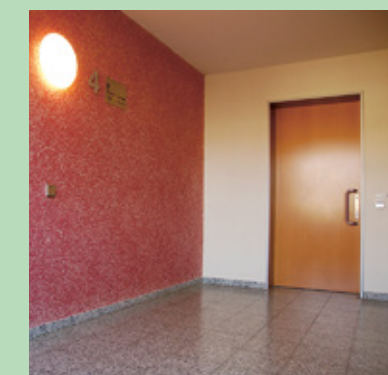
Ein freies Treppenhaus ist dringend erforderlich um Ihre Sicherheit und die Ihrer Nachbarn zu gewährleisten

Im Interesse aller ist daher jedes Mitglied aufgefordert, an der Sicherheit im Treppenhaus mitzuwirken.